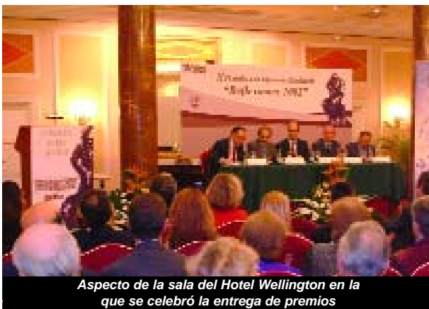
Aspecto de la sala del Hotel Wellington en la que se celebró la entrega de premios

discurso que pronunció en el acto de entrega de la segunda edición de estos premios, en el Hotel Wellington de Madrid. "Las instituciones sanitarias son