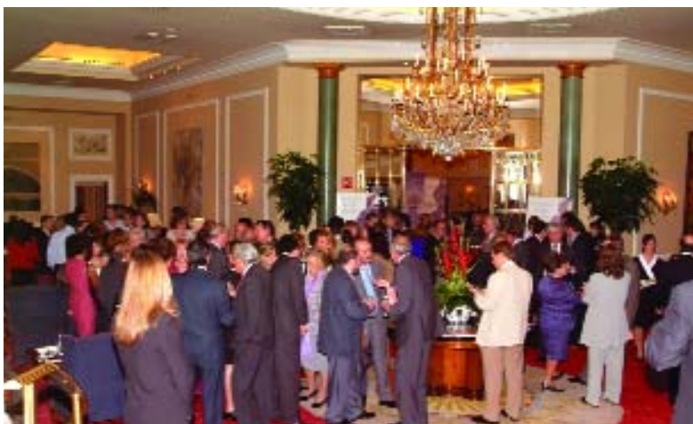
Momento del cóctel que se ofreció a los asistentes tras la ceremonia de entrega de premios