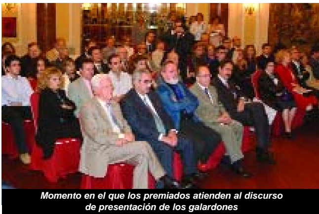
Momento en el que los premiados atienden al discurso de presentación de los galardones

El filósofo Fernando Savater recibió el pasado 30 de septiembre el Premio a la Opinión Sanitaria Reflexiones 2002, que conceden Revista Médica y la Fundación AstraZéneca. "Hay que preparar a los ciudadanos para poder utilizar mejor la democracia y disfrutar de las instituciones", subrayó el escritor en el