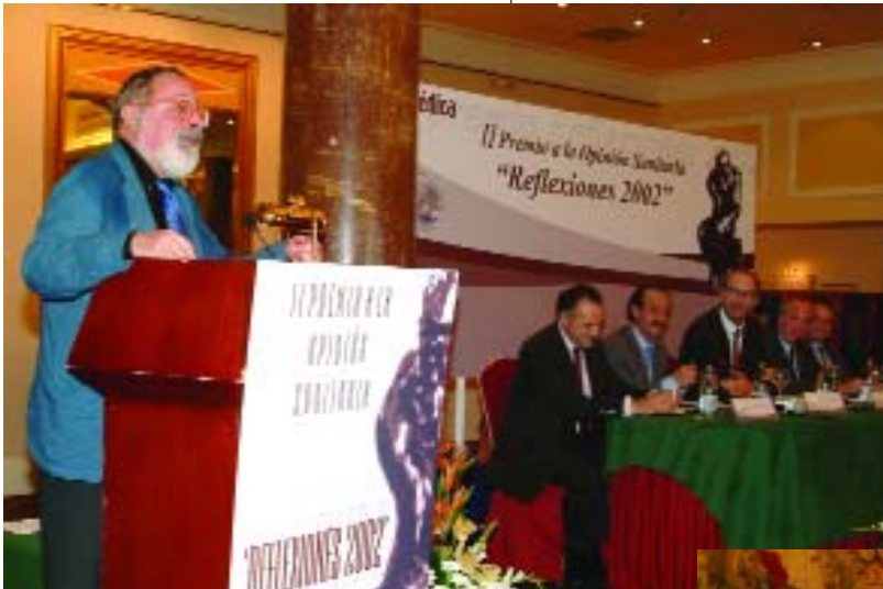
Fernando Savater durante su intervención tras recoger la estatuilla