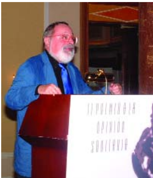
Savater subrayó la labor de la prensa en la educación sanitaria de los ciudadanos

“arruinar las ideas que se te ocurren para ver si aguantan”. Y esta es “la actitud verdadera de quien tiene temperamento científico”.