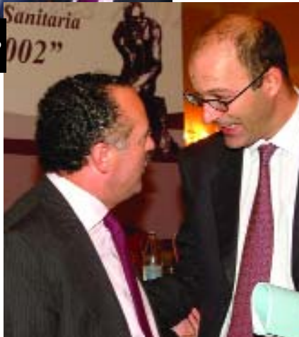
El editor de Revista Médica saluda al subsecretario de Sanidad

El viceconsejero de Ordenación Sanitaria estimó que el artículo Beneficiarios Feroces plasma a la perfección la situación que viven estos días muchos profesionales en su quehacer diario. “Según una encuesta europea, el 4% de los trabajadores asegura haber sido víctima alguna vez de violencia física real por parte de los clientes o usuarios”, apuntó. Con el fin de atajar este tipo de abusos en el ámbito de la sanidad madrileña, la consejería está preparando un protocolo de actuación